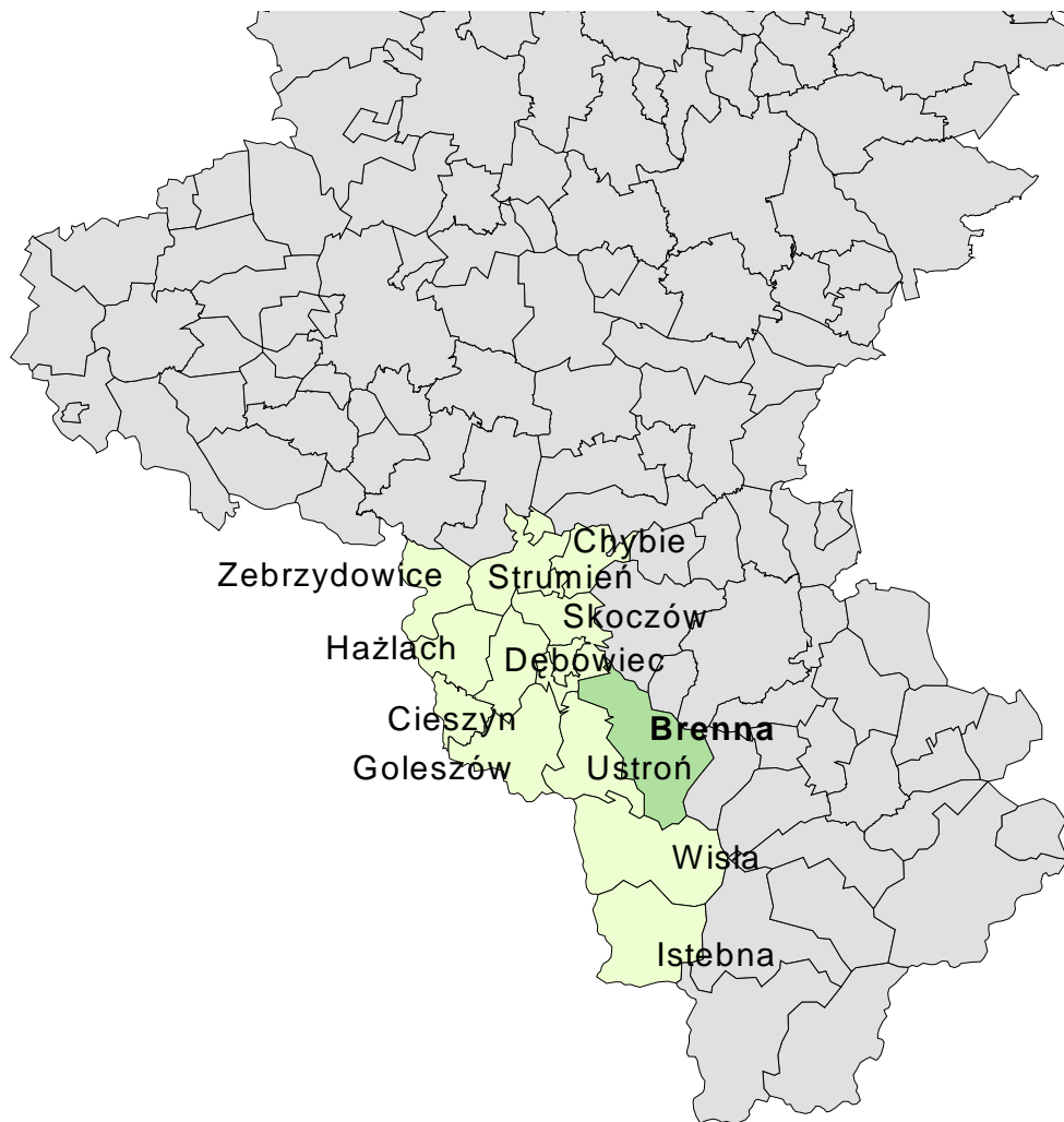
Mapa 1. Lokalizacja gminy Brenna

Dwa mniejsze miasta położone niedaleko Gminy to Skoczów (15 km) i Cieszyn (30 km) - główne ośrodki gospodarcze i kulturalne Ziemi Cieszyńskiej, w której Brenna ma swoje korzenie kulturowe. Natomiast najbliższym większym miastem jest byłe miasto wojewódzkie - Bielsko-Biała (33 km). Brenna leży w 80 km od Katowic, 118 km od Krakowa, 167 km od Zakopanego i 370 km od Warszawy.